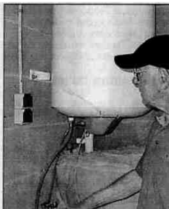
Le chauffe-eau est branché sur une prise partagée avec celle de la machine à laver.