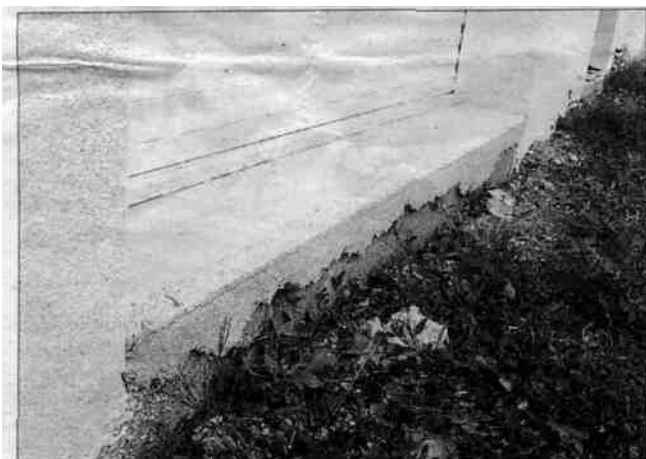
Trébeurden - La maison regorge de malfaçons grossières. Plus grave : la solidité des fondations paraît douteuse.